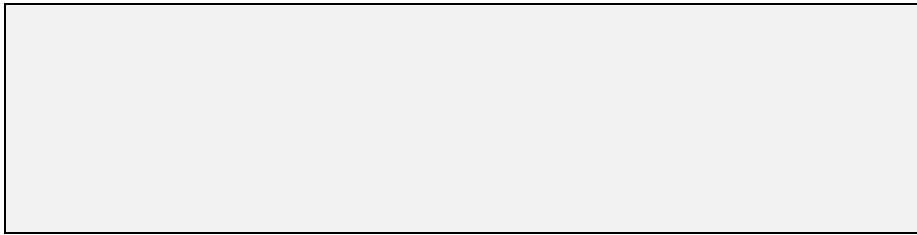
Слика 6. Наслов слике [1]